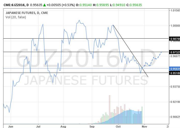
日元 2016 年 12 月份到期期貨合約日折線圖，虛線為預測走勢