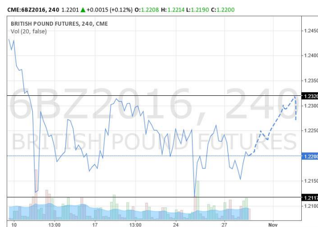
英鎊 2016 年 12 月份到期期貨合約 4 小時折線圖，虛線為預測走勢

預計英鎊仍維持在 1.2120 與 1.2320 之間的震盪走勢，本周預計將走高至 1.2320。