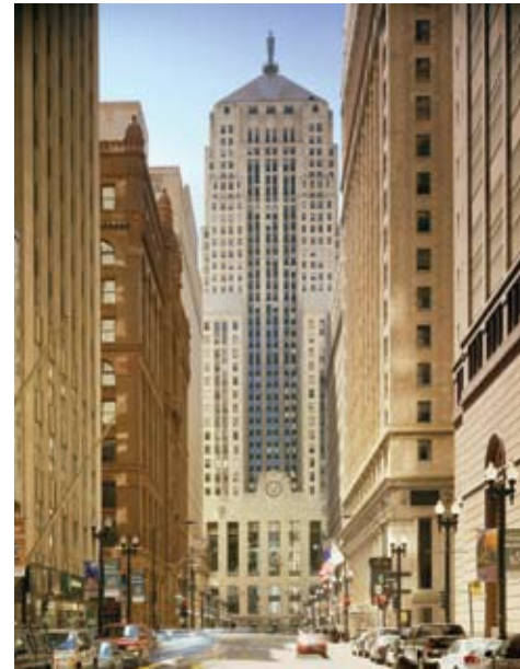
FIGURE DE PROUE DE LA RUE LASALLE

Le Chicago Board of Trade Building, monument historique local et national, a ouvert ses portes le 9 juin 1930. Construit par Holabird and Root, il a été pour un temps le bâtiment le plus élevé de Chicago, s'élevant à une hauteur de 609 pieds (186 mètres) en véritable figure de proue de la rue LaSalle, dans le quartier financier de Chicago.