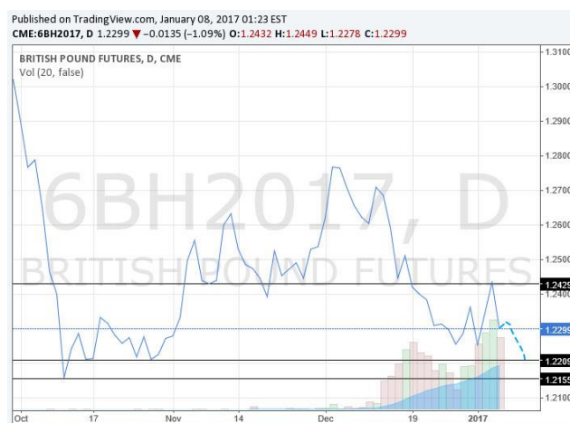
英鎊 2017 年 3 月份到期期貨合約日折線圖，虛線為預測走勢

上周五收盤於 1.2299。上周在美元高位回落的帶動下，英鎊也向上反彈至 1.2430 附近，但仍在此處遭遇較大阻力。退歐情緒以及對英國退歐後前景的不確定性將始終使英鎊承受較大壓力。美元走強的背景，英鎊或進壹步下跌。