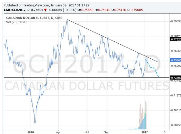
加元 2017 年 3 月份到期期貨合約日折線圖，虛線為預測走勢

上周五收盤於 0.75605。上周加元在 0.7380 的位置得到支撐向上反彈，源於上周美元多頭獲利平倉以及元旦期間交投清淡。然而加元仍保持在前方下降趨勢線下方。儘管減產協議帶動油價大幅上漲，但美國活躍鉆井機數持續增加仍使油價承壓。預計加元在美元走強的壓力下仍將繼續下行。