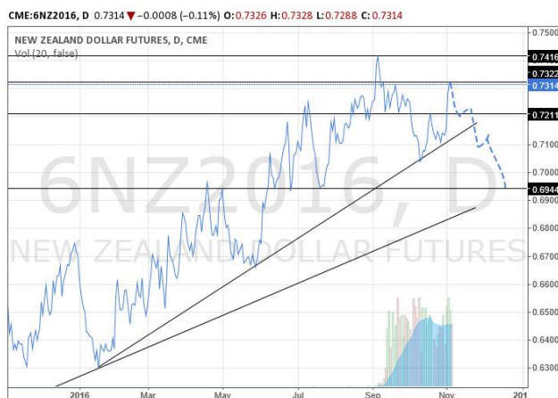
紐元 2016 年 12 月份到期期貨合約日折線圖，虛線為預測走勢

預計本周紐元將在 0.7320 或 0.7416 的阻力位受阻，若美國大選加息靴子落地，紐元有望跌破上升趨勢線，下跌至 0.6950。