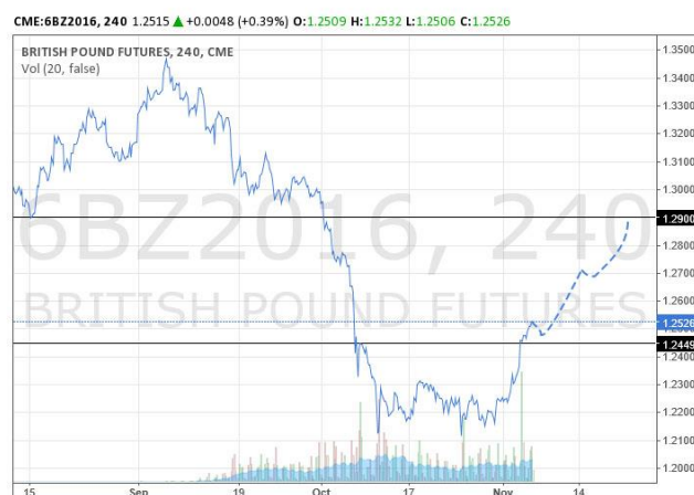
英鎊 2016 年 12 月份到期期貨合約 4 小時折線圖，虛線為預測走勢